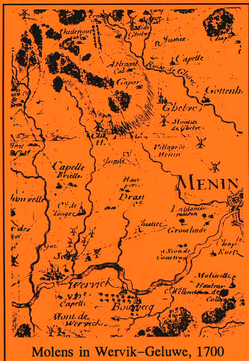
Molens in Wervik-Geluwe, 1700